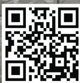
Imagen de (Un) Ser en la ciudad: caminata escénica.

CON EL APOYO DE: ESTUDIOS GENERALES LETRAS